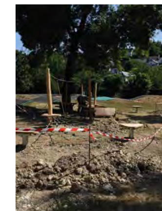
Implantation d'une nouvelle structure de jeux et déplacement de l'aire de jeux du Théâtre de Verdure vers le pumtrack