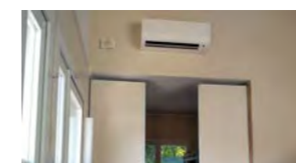
Mise en place d'une climatisation au Chalet du Moulin où se trouve la crèche pendant les travaux de La Terrasse