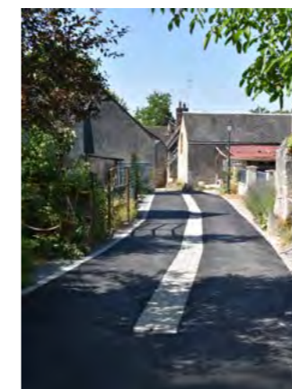
Réfection des enrobés chemin de la Chicane