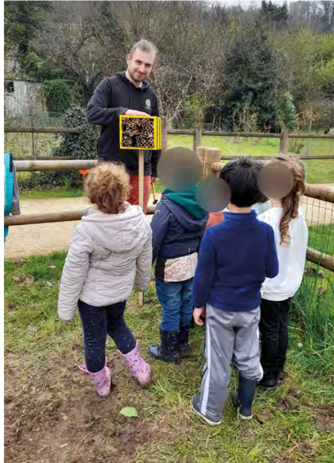
Les brouettes étaient de sortie pour la journée au jardin pédagogique des enfants de moins de 6 ans de l'ALSH.