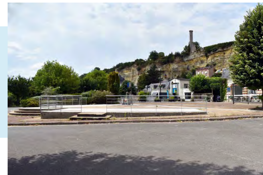
Fin des travaux