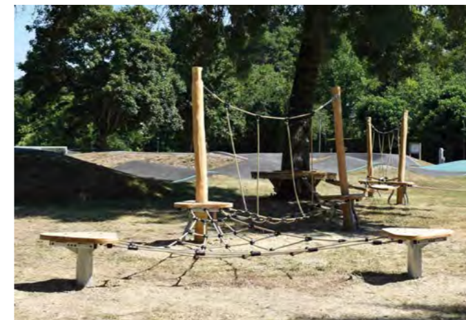
Implantation, par l'entreprise Proludic, de deux nouvelles structures sur les aires de jeux de l'école et du pumptrack (l'aire de jeux du Théâtre de Verdure a été déplacée vers le pumptrack)