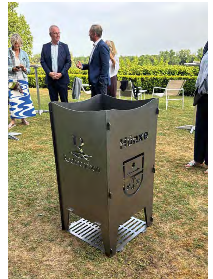
Les amis de Hünxe ont offert à la commune de Rochecorbon un brasero lors de leur visite les 29 et 31 mai 2025.