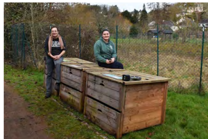
Installation par l'association Zéro Déchet Touraine d'un composteur partagé réservé aux habitants des Quatre Maréchaux. Projet à l'initiative de TMVL et soutenu par Rochecorbon