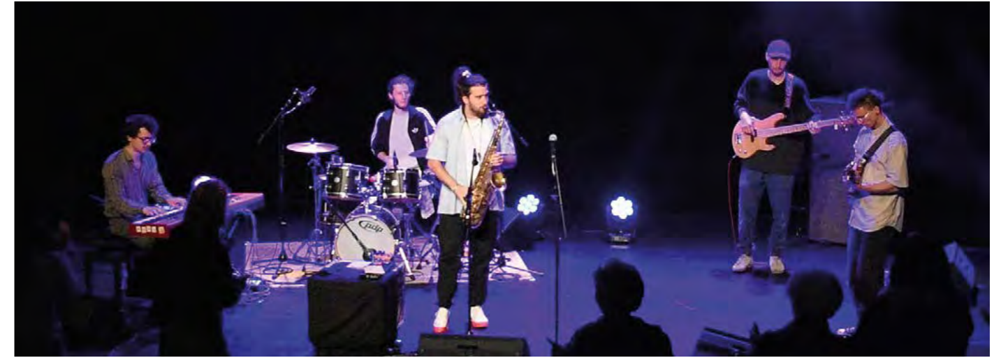
Dans le cadre du mois du jazz, Rhizome Orchestra a entraîné le public de Vodanum grâce à son groove punchy !