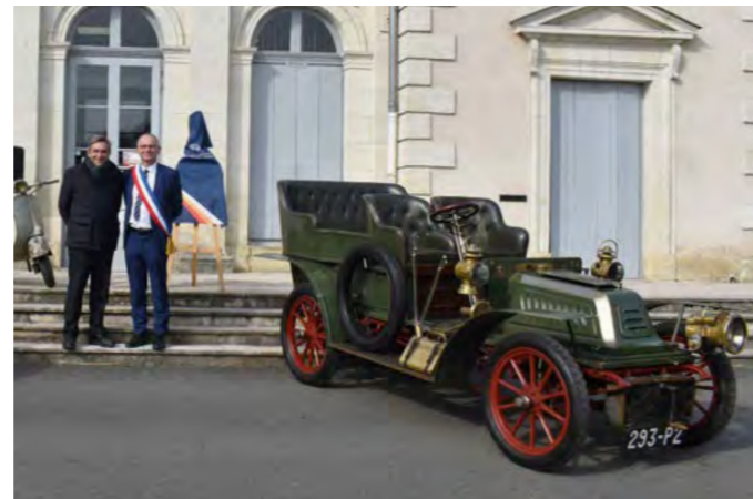
Daniel Labaronne, député de la 2ème circonscription d'Indre-et-Loire, était présent pour l'inauguration de la labellisation « Ville d'Accueil des Véhicules d'Époque » par la FFVE.