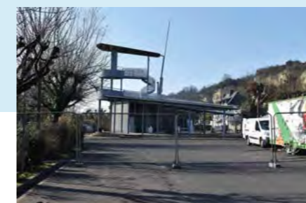
Début des travaux

Afin d'améliorer et de valoriser l'espace public, la ville de Rochecorbon et Tours Métropole Val de Loire ont entrepris la démolition de l'Observatoire et des locaux de l'ancien office de tourisme.