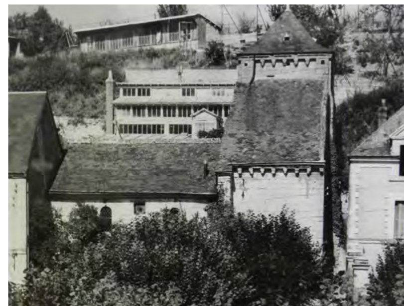
On aperçoit, au-dessus de la chapelle, le poulailler et l'extension-atelier tels qu'ils existaient encore en 1953.