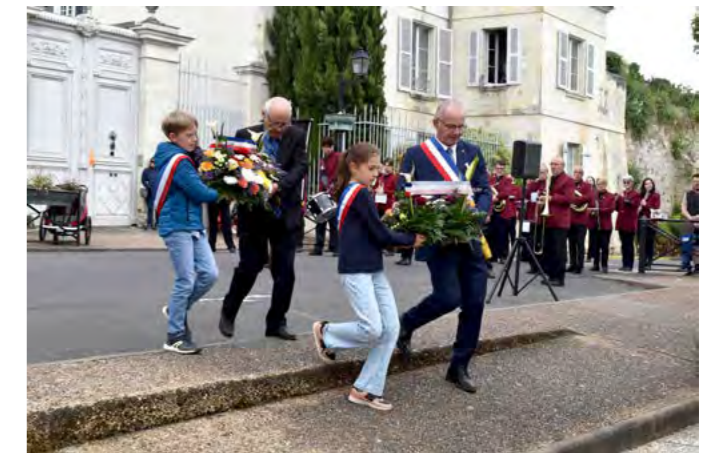
Commémoration du 8 mai 1945