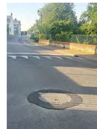
Remplacement des tampons (accès canalisations eaux usées, pluviales et potable) rue des Clouet