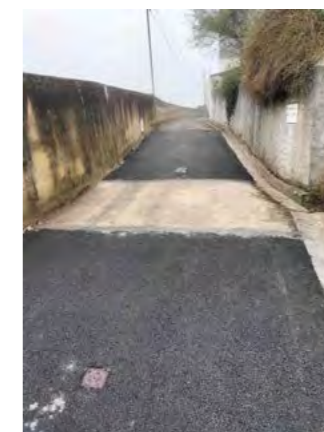
Réouverture à la circulation de la rue du Peu Boulin suite aux travaux de sécurisation et de remblaiement de la cavité qui avait entraîné l'effondrement de la chaussée